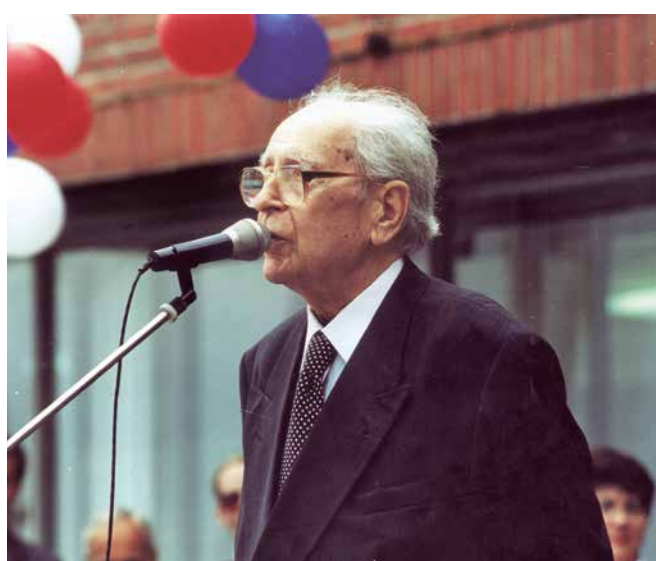
Академик Дмитрий Лихачев на Университетской площади 1 сентября 1995 года