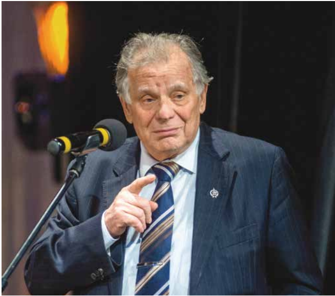
Нобелевский лауреат Жорес Алферов