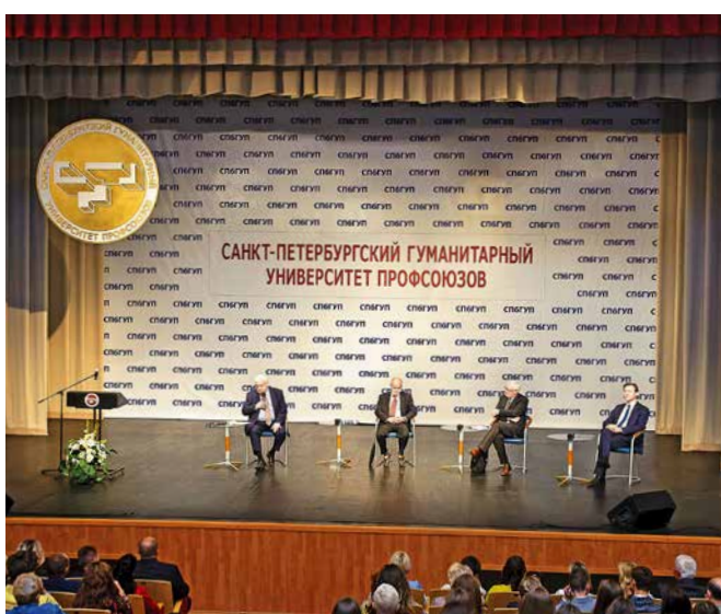
Международные Лихачевские научные чтения, Театрально-концертный зал СПбГУП