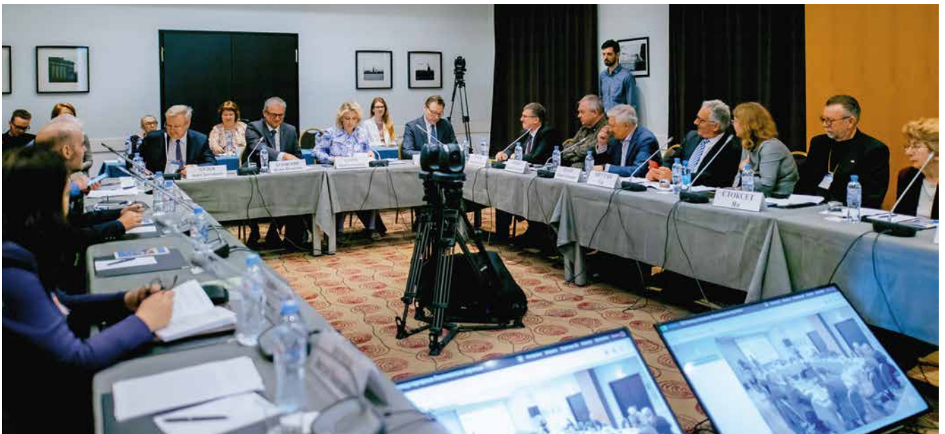
XXI Международные Лихачевские научные чтения. Заседание секции (конференц-зал отеля «Рэдиссон»), 26 мая 2023 года