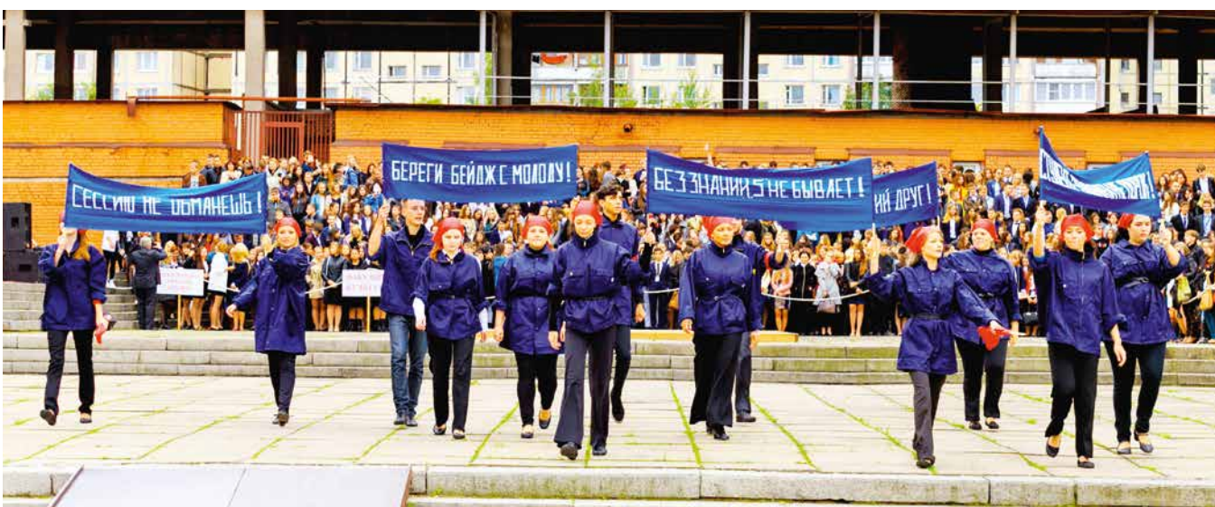
Знаменитая профсоюзная «Синяя блуза» (студенты-актеры СПбГУП). День знаний на Университетской площади