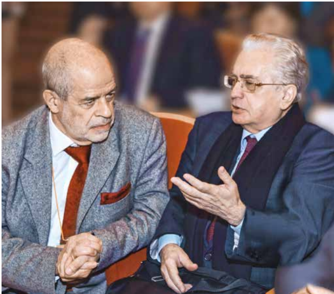
Академики Виталий Наумкин и Михаил Пиотровский