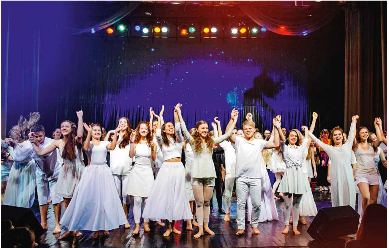
Студенческий праздник в Театрально-концертном зале СПбГУП

Комплекс прошедших практическую апробацию исследований «Разработка и реализация модели гуманитарного университета», выполненных группой ученых на базе СПбГУП, в 2000 году был выдвинут Правительством Санкт-Петербурга на соискание Государственной премии России .