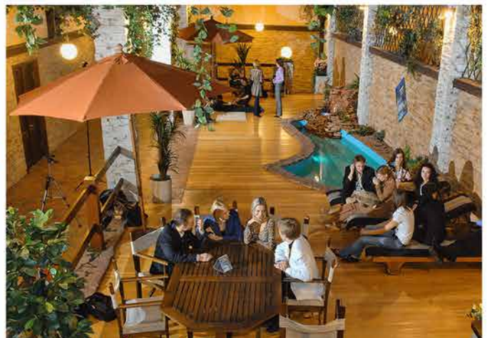
Праздник последнего звонка, Итальянская улица, Международные Лихачевские научные чтения, рекреация «Пляж»