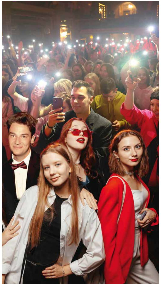
Праздничный вечер 1 сентября в клубе