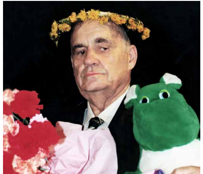
Кинорежиссер Эльдар Рязанов