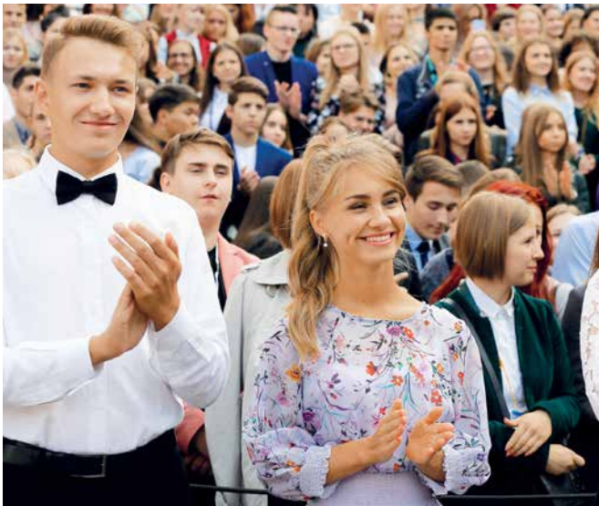
Студенты СПбГУП на празднике День знаний. 1 сентября