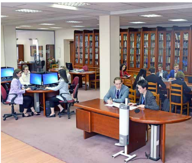
Студенты СПбГУП в Научной библиотеке им. Д. А. Гранина СПбГУП