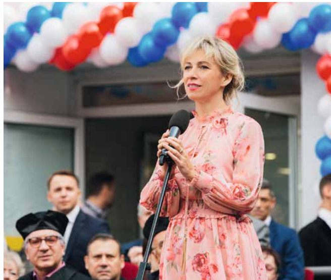
Чрезвычайный и Полномочный Посол РФ М. В. Захарова на праздновании Дня знаний в Университете