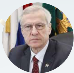
Иван МОХНАЧУК, ПРЕДСЕДАТЕЛЬ РОССИЙСКОГО НЕЗАВИСИМОГО ПРОФСОЮЗА РАБОТНИКОВ УГОЛЬНОЙ ПРОМЫШЛЕННОСТИ

«От имени Центрального комитета Росуглепрофа, от всех угольщиков Российской Федерации, от себя лично поздравляю общенациональную организацию «Всероссийский Электропрофсоюз» с юбилеем! Ваш профсоюз за 120 лет своего существования стал влиятельной силой в борьбе за права и интересы трудящихся электроэнергетики, энергетической строительства и электротехнической промышленности.