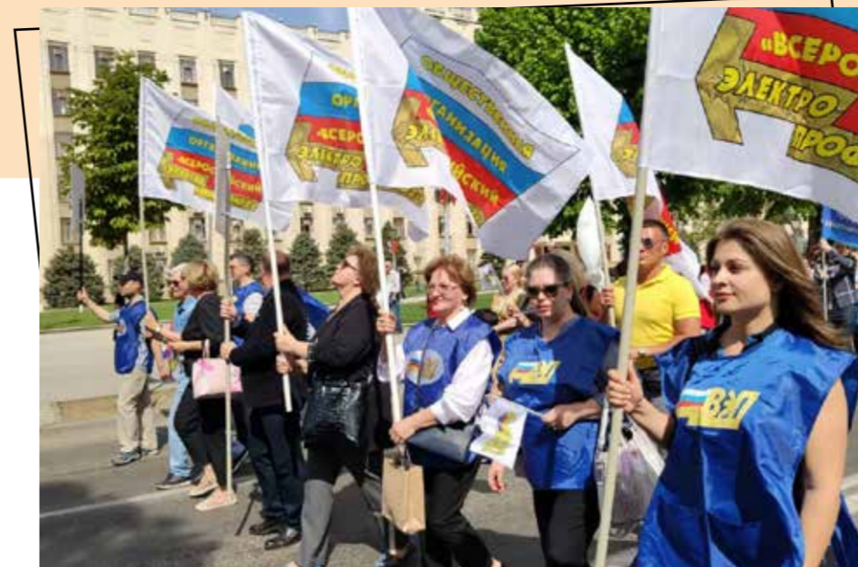
Члены Краснодарской краевой организации ВЭП на первомайской демонстрации

Ведь не секрет, что в подавляющем большинстве случаев решения региональных энергетических комиссий относительно затрат на персонал нещадно урезают полностью обоснованные предложения. И вообще считаем, что расходы в тарифах регулируемых субъектов на