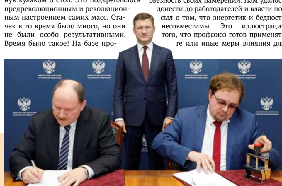
В Минэнерго Отраслевое тарифное соглашение в электроэнергетике РФ на 2019–2021 годы подписали Председатель ВЭП Юрий ОФИЦЕРОВ, министр энергетики Александр НОВАК, Президент Ассоциации «ЭРА России» Аркадий ЗАМОСКОВНЫЙ.