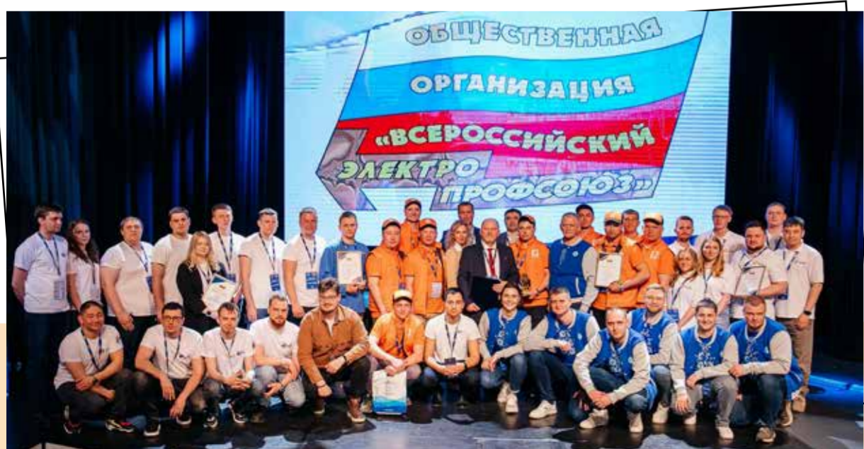
1 Всероссийский турнир по охране труда и промышленной безопасности «Брейн-ринг», 2024 г.

Такая вовлеченность объясняет долгую и успешную историю профсоюза. Сочетая защиту прав работников с реальными шагами по повышению престижа рабочих профессий, Всероссийский Электропрофсоюз доказывает свою значимость. Убедена, что ВЭП продолжит поддерживать специалистов своей отрасли, в том числе и в сотрудничестве с Минтрудом России».