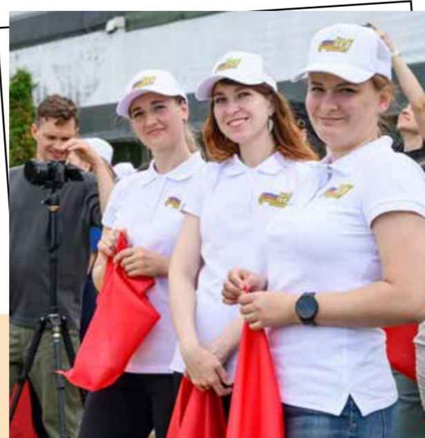
Молодежь — стратегический резерв Профсоюза