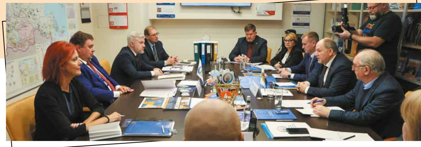
Участники заседаний совместной Комиссии — 10 февраля 2026 г.

После реформы в электроэнергетике осталось порядка 700 тысяч человек, из